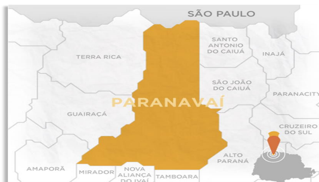
Figura 1 – Localização do município onde foi desenvolvida a pesquisa, Paranaíba-Pr, 2023

Entre novembro de 2022 e fevereiro de 2023, foi conduzido um teste piloto com seis indivíduos idosos, que não participaram da amostra final, enquanto a coleta de dados definitiva ocorreu nos meses de março e maio de 2023 com nove pessoas idosas.