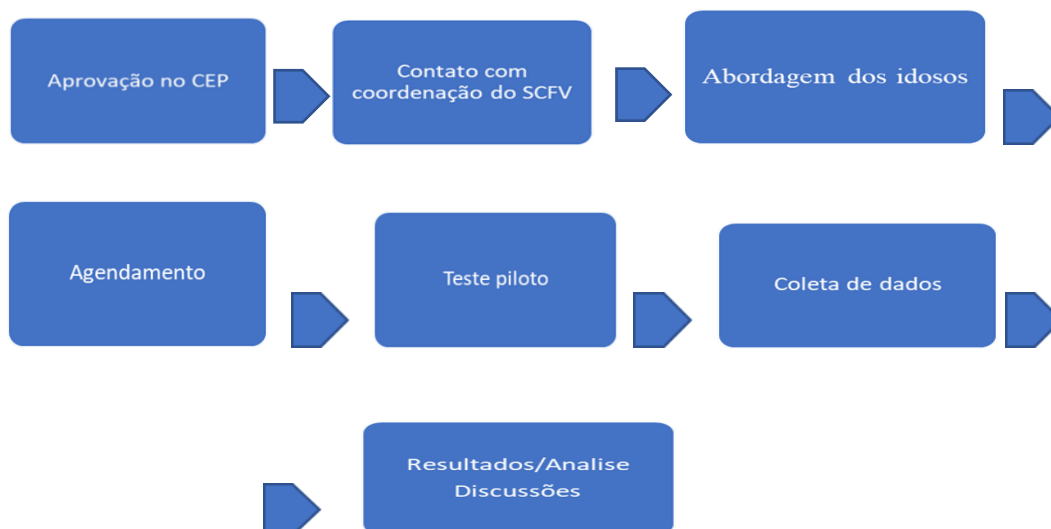
Fluxograma 1 – Sequência do procedimento de coleta de dados, Paranaíba-Pr, 2023.

No dia da entrevista, foi informado a necessidade do uso do gravador para responder ao roteiro de questões, o que permitiria um maior número de informações quanto ao assunto abordado, para tanto foi solicitada permissão ao idoso para gravação da entrevista, sendo esta aceita por todos. É pertinente ressaltar que o uso do gravador garante uma análise precisa das falas e permite transcrevê-las fielmente. Conforme Minayo (2010, p. 63), esse recurso é definido como “[...] possível trabalharmos com um sistema de anotação simultânea da comunicação ou fazermos uso de gravações” [...], e esse registro amplia o conhecimento do estudo porque nos proporciona documentar momentos ou situações que ilustram o cotidiano vivenciado.