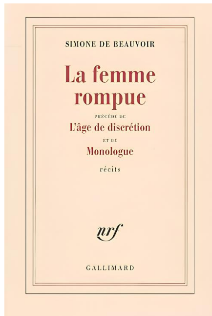
Figura 1: Capas de A mulher desiludida : (a) edição original francesa ( La femme rompue ), publicada pela Gallimard, e (b) edição da Nova Fronteira utilizada nesta dissertação.

A obra A mulher desiludida (2021 [1967]) ilustra a filosofia existencialista beauvoiriana, a partir da angústia feminina vivenciada pelas personagens que protagonizam as três novelas que compõem o livro. Como citamos anteriormente, o livro é composto por três novelas, intituladas “A idade da descrição”, “Monólogo” e “A mulher desiludida”. A autora descreve a severa realidade imposta às mulheres, especialmente na maturidade, que assistem seu valor social desmoronar com o passar dos dias, ao passo que concluem seu papel de mãe e esposa e, então, são jogadas à inutilidade. A essa altura, são forçadas a rever conceitos, crenças e valores, aos quais se apegaram durante toda sua vida, passando a se perceber em uma intensa crise de identidade causadora de extremo sofrimento 9 . Nesse ínterim, dedicam-se e sofrem por questões acerca de suas famílias, do relacionamento com filhos ou com maridos e do próprio envelhecimento.