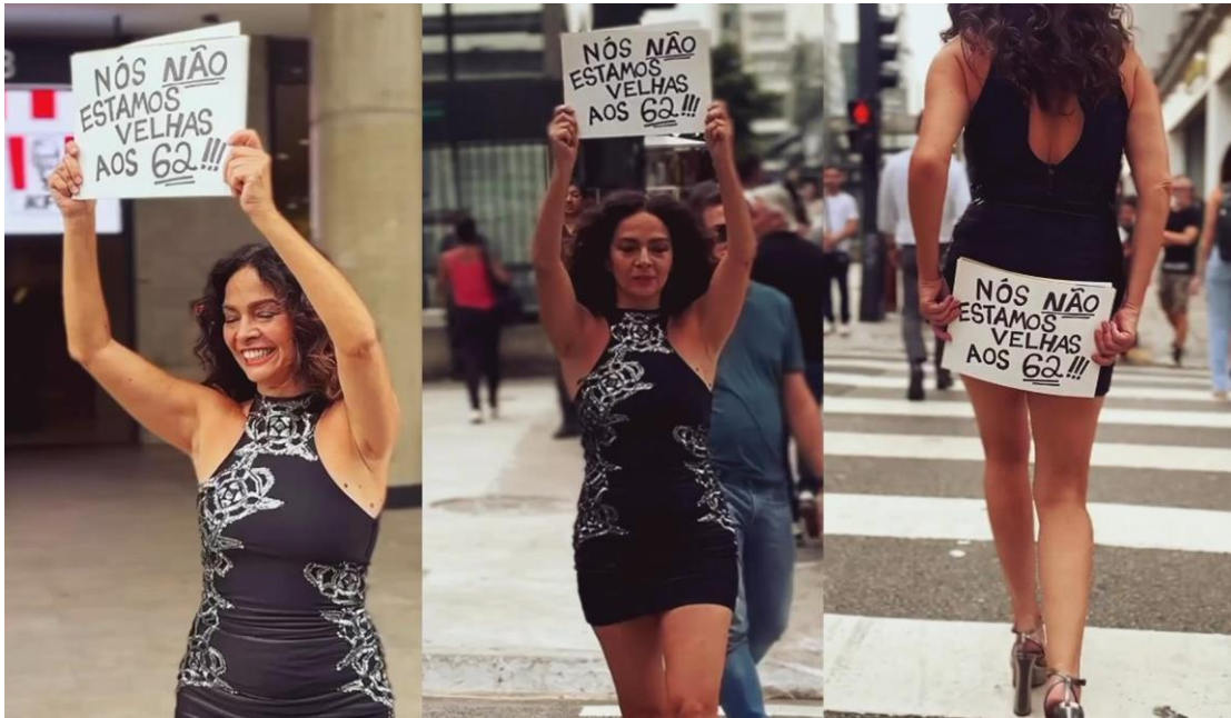
Figura 7 - Claudia Ohana faz protesto contra etarismo – Março de 2025.

(Claudia Ohana..., 2025, n.p.), afirmou ao compartilhar o vídeo do protesto no Instagram . O posicionamento de Ohana confronta a imposição de um visual que associa a mulher envelhecida à imagem de alguém antiquada e impotente, evidenciando a necessidade de rompermos com representações cristalizadas acerca do envelhecimento e de reconhecer a dignidade desta fase da vida, conforme pode ser observado na figura 7.