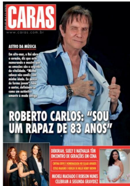
Figura 5: Capa da Revista Caras – Abril de 2025.