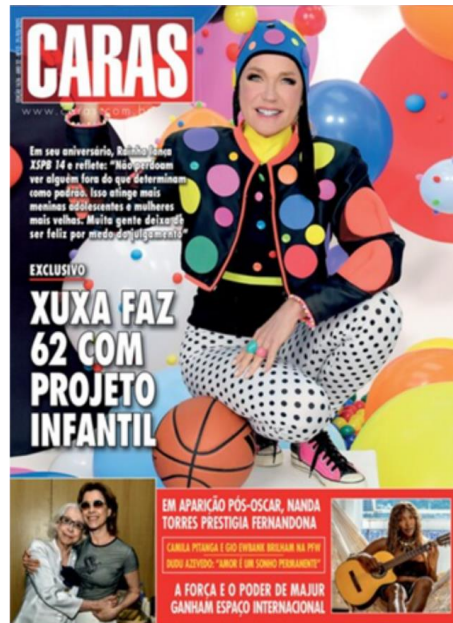
Figura 4: Capa da Revista Caras – Março de 2025.