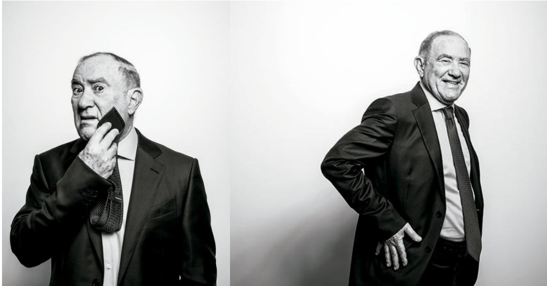
Figura 6: Renato Aragão para a revista Poder – Novembro de 2017.