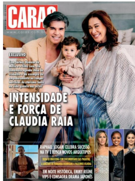
Figura 3: Capa da Revista Caras – Setembro de 2024.